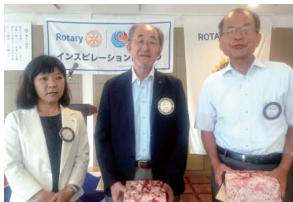
水庫会長と会員誕生日の遠田会員と岡田会員